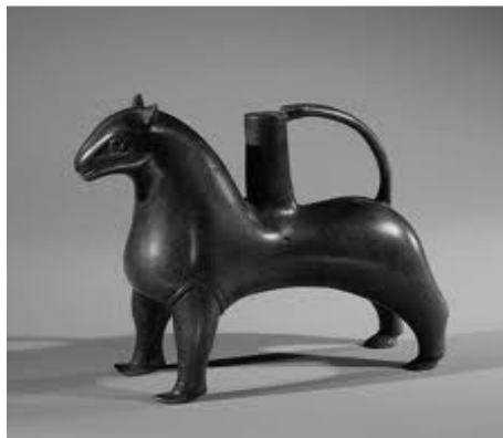
Aquamanile, brons, 13 e eeuw Maasstreek, hoogte ± 12.5 cm.

Het paardenkopje, helaas ontbreken de oren en de rest, behoort nog altijd tot de collectie van Museum Kasteel Wijchen. Het kopje is ongeveer 7 cm. hoog, de hoogte van het totale beeldje zou dan 15-17 cm. geweest kunnen zijn. Het is niet duidelijk wat het precies is en waar het voor gediend heeft. Er is wel verondersteld dat het een fragment is van een aquamanile. Een aquamanile is een bekken of schenkkan om aan tafel de handen te reinigen; aqua is Latijn voor water en manus voor hand. In de Romeinse tijd werden aquamanilen al bij het eten gebruikt. Behalve eenvoudige, vaasvormige schenkkanen waren er ook aquamanilen in de vorm van (fabel)dieren (paarden, leeuwen, vogels) en mensen (ridders te paard). In de middeleeuwen stonden ze, vooral bij de hogere standen, bij de maaltijd op tafel. Vanaf de 12de eeuw kreeg de 'waterkan' ook een plaats in de kerk. De priester waste zijn handen vóór hij het misoffer bracht.