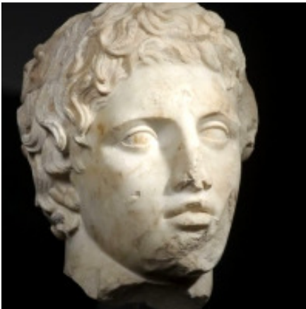
Jongenskop: een meesterwerk van beeldhouwkunst