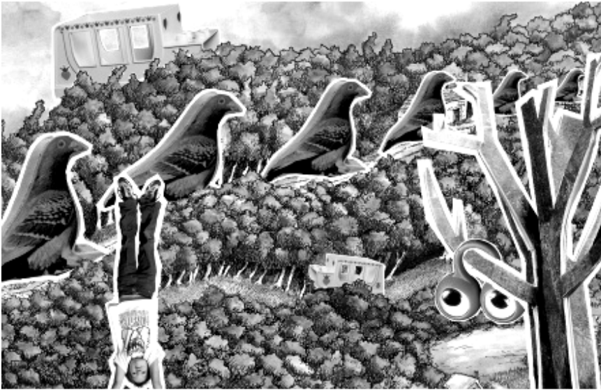
Museumland in Toenland, Museum voor Communicatie Den Haag