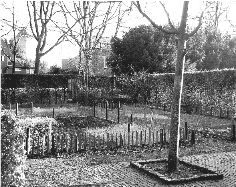
De 'Tuun' na de winter, met overgebleven wintertarwe.