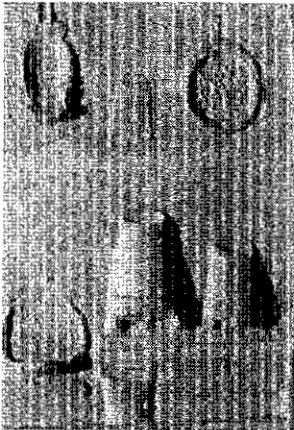
Ultrusting van een Romeinse bakker

Op 11 juni 2006 wordt de tentoonstelling 'Het dagelijks brood' geopend.