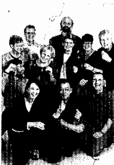
Dropveter mensen 2005

De fototentoonstelling heeft veel losgemaakt en het ziet er naar uit dat er een blijvend vervolg op komt. Om te beginnen ziet het er naar uit dat het project uit 1986 deze zomer al op de markt in de herhaling zal gaan. Er is veel vraag naar de oude foto's en de gemeente Wijchen is van plan een fotoboek samen te stellen. In de raadzaal zullen uitvergrotingen van een aantal foto's de muren gaan sieren. Een tentoonstelling met een staartje, maar wel een leuk staartje. Wie zin heeft om dat ook eens mee te maken kan meedoen bij het vervolg of kan daar alvast eens over nadenken. De projectgroep, die deze tentoonstelling heeft voorbereid heeft in ieder geval alleen maar positieve gevoelens aan die periode overgehouden. Het werken in een projectgroep heeft voor deelnemers, maar ook voor het resultaat van hun inspanningen goed gewerkt: je bent gedurende een periode, die te overzien is, heel intensief bezig en je kunt je talenten of kennis op een bepaald terrein weer eens heel anders inzetten en het levert ook nog eens iets leuks op. Wat wil je nog meer? Een beeld van een foto.