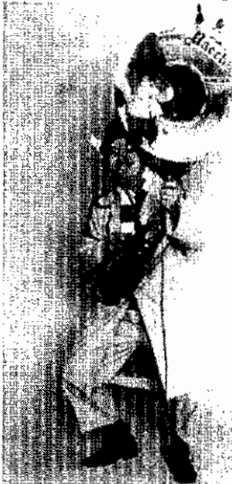
De Hoornblazer 1986

ontstond er een beeld hoe een tentoonstelling, die in het museum, maar ook daarbuiten te zien zou zijn, eruit zou kunnen zien. Tegelijkertijd ging er ook een brief de deur uit naar ondernemers in het centrum van Wijchen, waarin de vraag gesteld werd of zij gedurende de tentoonstelling in het museum ook een poster in hun winkel wilden exposeren onder het motto 'Kom over de brug'. Breng een stukje tentoonstelling over de brug naar een andere plek in Wijchen. Dit lukte wonderwel. De Hema had zelfs een minitentoonstelling geadopteerd. In het Mozaïek, natuurlijk foto's van een toneel- of muziekgroep, waren foto's te zien en in vele winkels. Op de posters waren originele oude foto's uit 1986 geplakt, foto's die enigszins aansloten bij de aard van de winkel of het bedrijf.