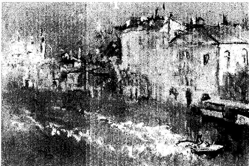
Naderend onweer – Canal Grande Venetië. 12.0 x 19.8 cm.

Behalve de 'sgraffito-pastels', toont Boerwinkel in Museum Kasteel Wijchen een keur aan schetsen en tekeningen uit de vele schetsboeken, die het basismateriaal vormen voor het ontstane oeuvre .