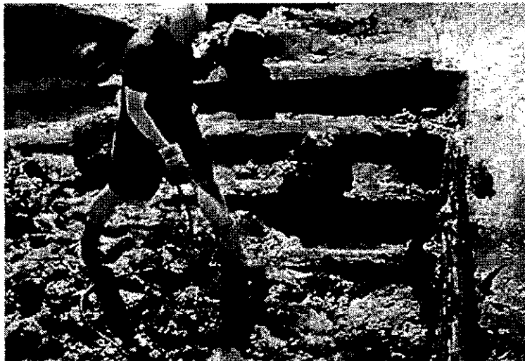
Opnieuw Romeins schip gevonden in Utrecht.

de verbeelding spreekt, maar waarover toch niet zo heel veel bekend is buiten de bekende Romeinse centra. West-Germania was zo'n buitengebied en deze vondsten geven een nieuwe kijk op de omstandigheden in de lage landen tijdens de Romeinse tijd.