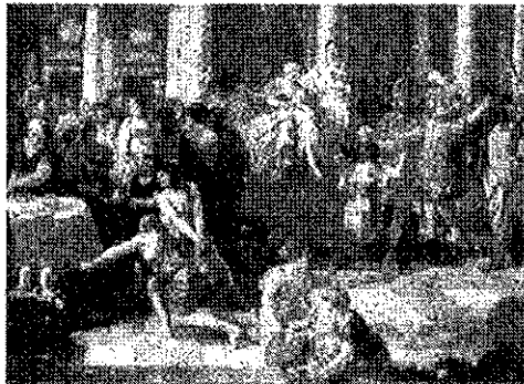
Figuur 1: een doorsnee Romeinse keuken

poepers met de meest erge straffen bedreigt werden. Het tegenwoordige wildplassen in Nijmeegseportieken is dus kennelijk een overblijfsel uit de Romeinse tijd.