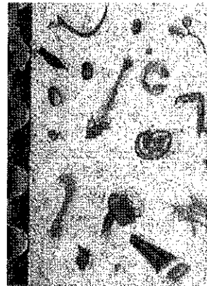
Figuur 2: een romeinse vloer

Ook binnenshuis groeide de afvalberg. Uit opgravingen van Romeinse huizen blijkt dat het 'kleinste kamertje' vaak direct in de keuken lag (zie figuur 1). De Romeinse keukens zijn zondermeer ware goudmijnen voor archeologen. De Romeinen gooiden vaak hun keukenafval op de vloer. Omdat deze vloer vaak uit leem bestond werd het afval simpel in de bodem gestampt. Ook in de eetzaal werd op dezelfde manier omgegaan met dat wat van het eten overbleef. Een geliefd patroon voor mozaïekvloeren in eetzaal waren etensresten, die over de vloer verspreid waren (zie figuur 2). Fraaie plaatjes van afgekloven botten, visgraten, druiventakken, lege mosselschelpen en dergelijke versierden de vloer onder de tafel van de heer des huizes. Voor zo'n versiering had men goede redenen: Met zo'n vloer viel het amper op dat de resten van een feestelijk diner op de grond gegooid werden. Toch hebben de Romeinen ook al aan recycling gedaan. Voor Romeinen met hoge nood stonden in zijstraatjes speciale amphoren met een grote opening, waarin men zijn blaas kon ledigen. Het aldus opgevangen vocht werd vervolgens door leerlooiers en wevers gebruikt om hun stoffen te looien. Op deze wijze beschikten zij over een nimmer opdrogende bron van voor hun ambacht noodzakelijke grondstoffen.