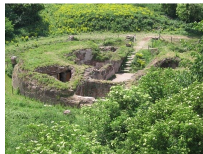
Fort St. Andries: Huidige status