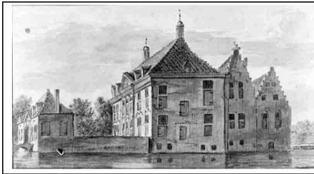
Het Huys te Leeuwen C.Pronk 1745 Heemkundevereniging Leeuwen

Als de Fransen in 1672 het Land tussen Maas en Waal in hun greep hebben staan ze ook daar vrijheid van godsdienst toe. Het is ongetwijfeld zo dat de rooms-katholieken blij waren hun afgenomen kerken terug te krijgen. Het antwoord daarop van protestantse zijde in 1674, toen de Fransen Wamel als voorbeeld verlieten, was keihard. Wat er namelijk gebeurde was dat niet alleen aan