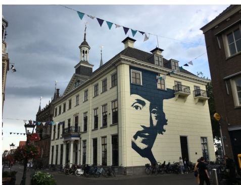
Stedelijk museum Kampen