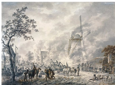
Plunderen van een dorp, Dirk Langendijk 1805, Atlas van Stolk

Op 1 mei 1676 werden het kasteel en het stadje grotendeels verwoest. Als voorbeeld van wat dat betekende een schilderij van Dirk Langendijk 1805 met de titel "Soldaten plunderen dorp". In Maasbommel werd, zie verderop het schaderapport, ook de molen in brand gestoken.