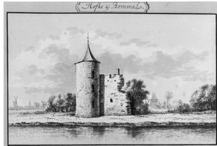
Hof te Bommel, Abraham de Haen, RKD

Het kasteel werd ook verwoest en nooit meer opgebouwd. Na de verwoesting van het kasteel werd het genoemde rapport opgemaakt van wat er allemaal was meegenomen door de Fransen.