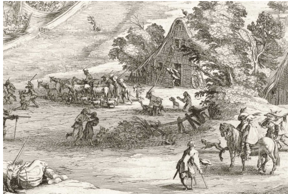
Plundering platteland Jacques Callot 1628, Rijksmuseum

Een treffend voorbeeld van plundering wat betreft het gebied als geheel was dat voordat in 1674 Von Rabenhaupt en stadhouder Willen III Grave belegeren en uiteindelijk innemen de Fransen voor het beleg om zich te bevoorraden onder andere 800 koeien weghalen uit het Land van Maas en Waal en het Land van Cuijk. 4