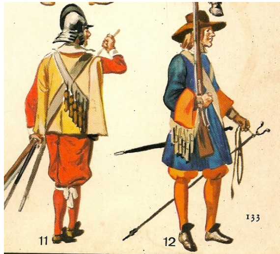
Hollandse soldaten 1691