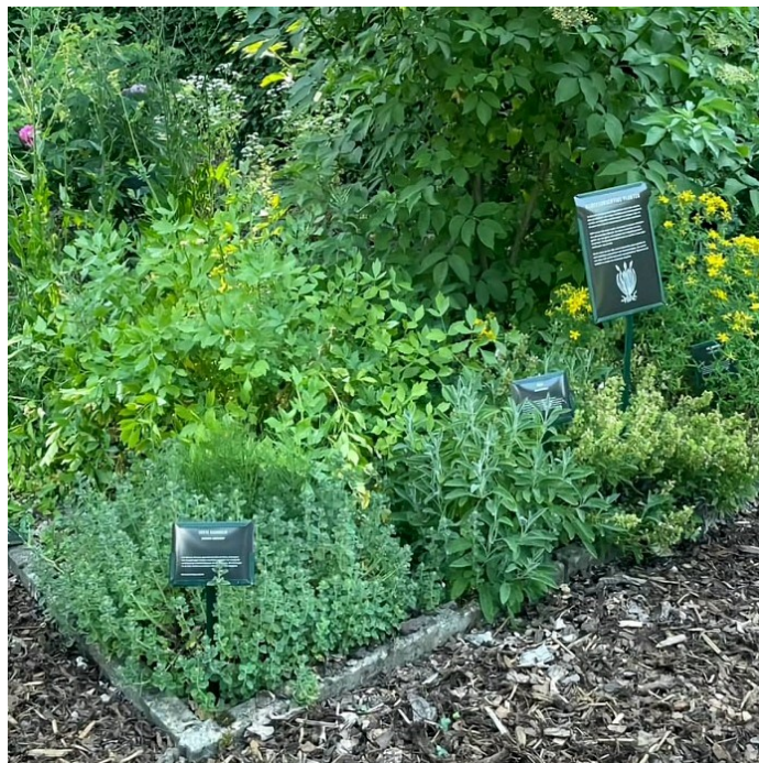
De Tuun