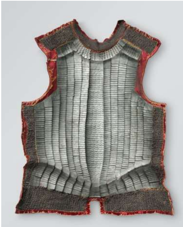
Brigandine pantser, 1570-158.

Een andere bijzondere vondst is een lamel van een brigandine pantser. Dit is een onderdeel van een middeleeuws harnas (zie afbeelding) waarvan de binnenkant volledig bestaat uit honderden metalen lamellen. Dit type harnas is uitgevonden in Italië in 1340, ter bescherming tegen de steeds beter wordende vuurwapens. Het grote voordeel van de brigandine is dat die naast goede bescherming ook zorgt voor voldoende wendbaarheid, ten opzichte van een harnas dat uit grote stukken metaal bestaat. Bovendien is de brigandine goedkoper om te maken, er konden immers restmaterialen worden gebruikt. Zowel aan de buitenzijde als aan de binnenzijde werd er textiel over de lamellen geplaatst.