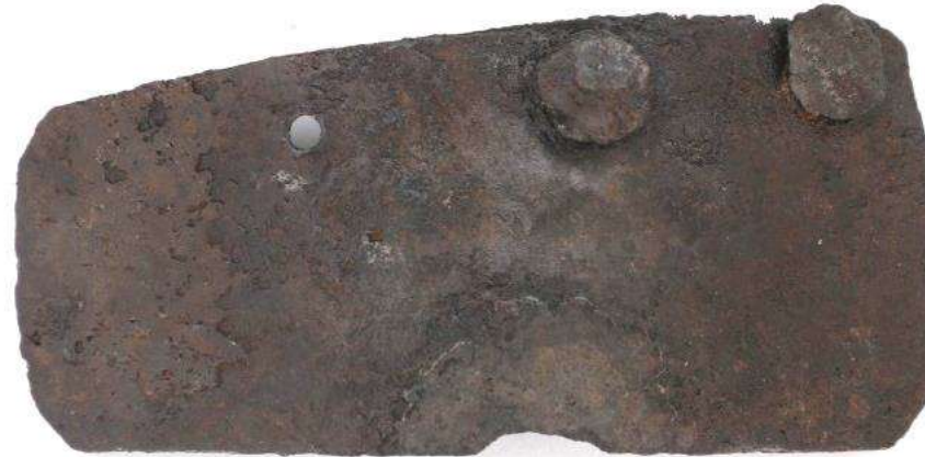
Lamel van brigandine pantser, 1350-1400.

Een andere bijzondere vondst is een lamel van een brigandine pantser. Dit is een onderdeel van een middeleeuws harnas (zie afbeelding) waarvan de binnenkant volledig bestaat uit honderden metalen lamellen. Dit type harnas is uitgevonden in Italië in 1340, ter bescherming tegen de steeds beter wordende vuurwapens. Het grote voordeel van de brigandine is dat die naast goede bescherming ook zorgt voor voldoende wendbaarheid, ten opzichte van een harnas dat uit grote stukken metaal bestaat. Bovendien is de brigandine goedkoper om te maken, er konden immers restmaterialen worden gebruikt. Zowel aan de buitenzijde als aan de binnenzijde werd er textiel over de lamellen geplaatst.