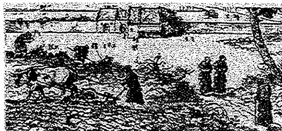
Ontginningen rond Balgoy (12 e eeuw)

Voor Balgoy en Keent is van belang te weten dat het wereldlijk onder Utrecht viel en kerkelijk onder Keulen. De beide buurschappen behoorden kerkelijk tot één kerspel en vormden op den duur de kern van de hoge heerlijkheid "Balgoy en Keent"