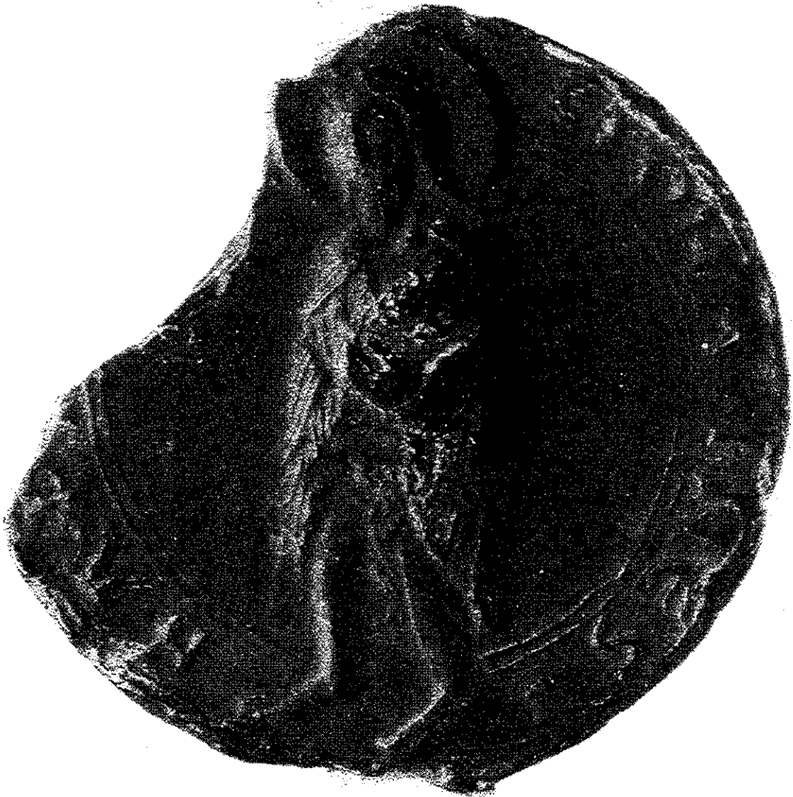
Zegel van oorkonde van Kapittel van St. Jan (1288).