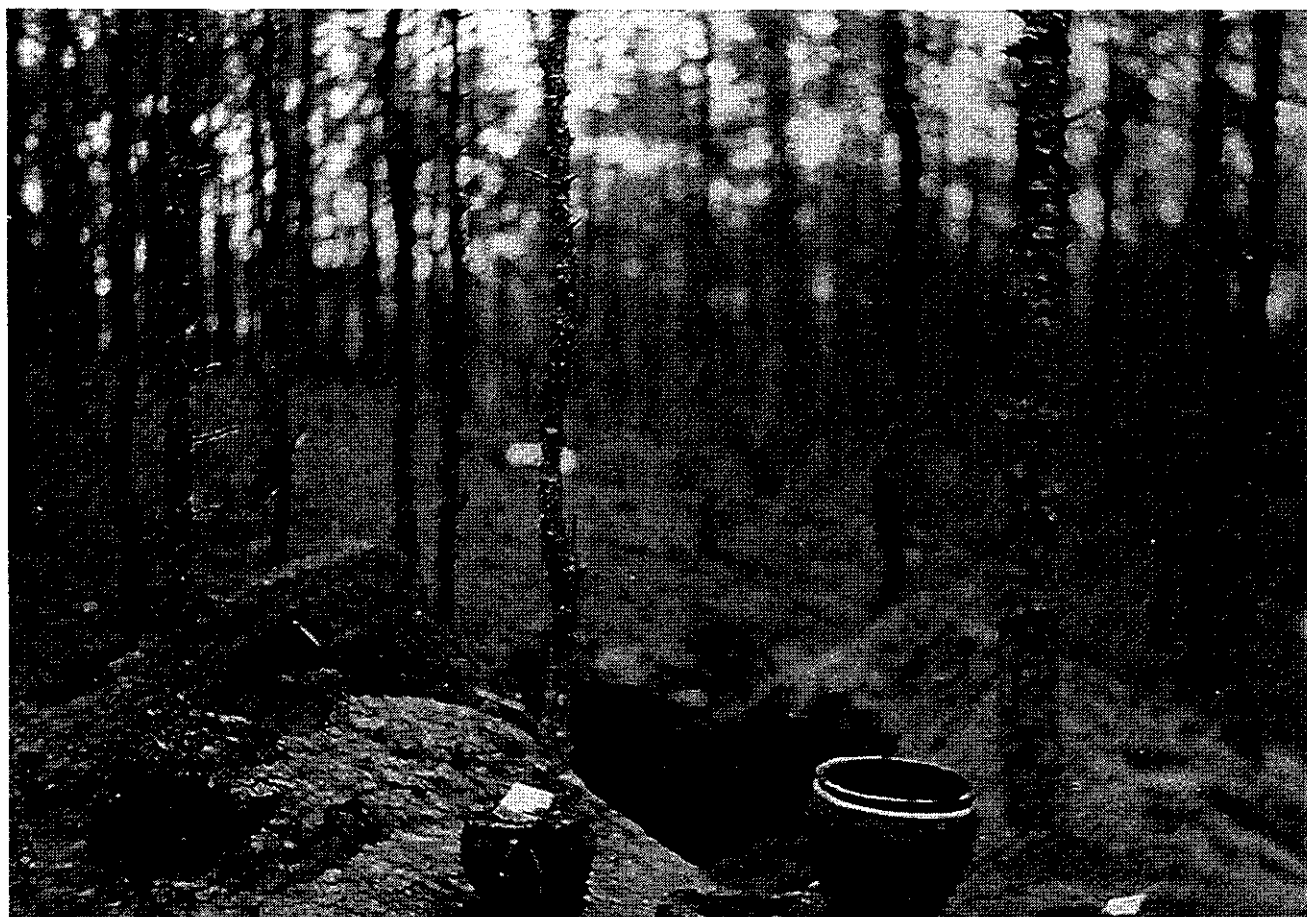
Een beeld van de opgravingen waarmee Frans Bloemen in 1917 is begonnen.