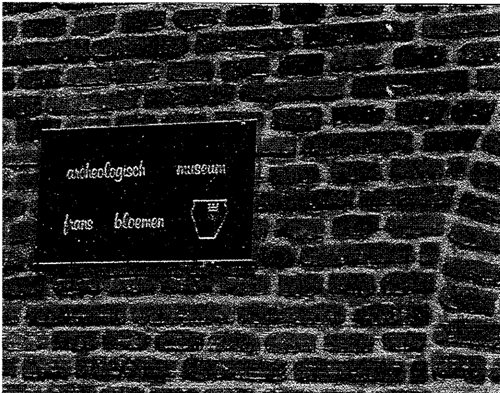
Naambord museum op het koetshuis