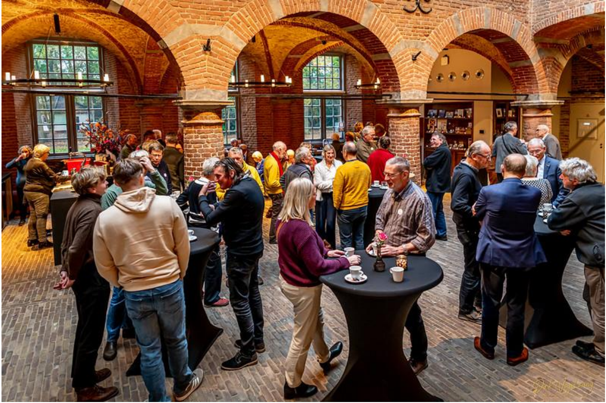
Pauze in de Koffiecorner op de binnenplaats