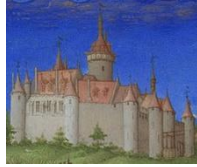
Gebr. v. Lymborch