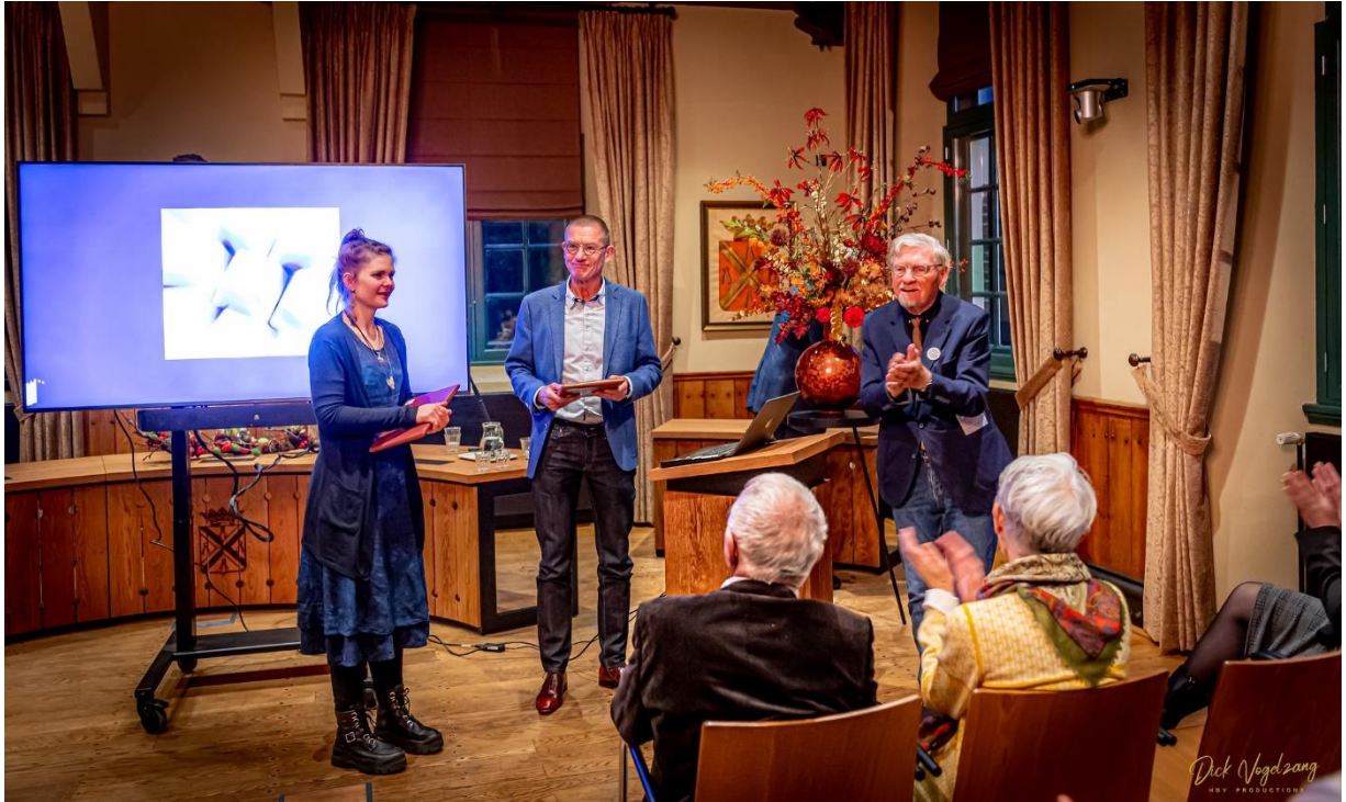
Applaus en een bedankje voor de beide gastsprekers